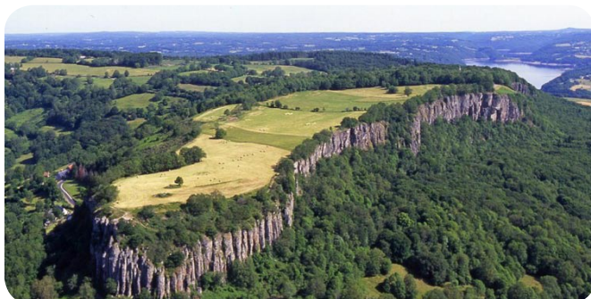
Les Orgues de Bort à Bort les Orgues

05.55.20.78.90 udap.correze@culture.gouv.fr