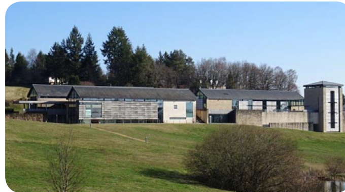
Musée du président Jacques Chirac à Sarran

Le paysage corrézien est composé de facettes multiples et contrastées. De plateaux et gorges au sud du département notamment dans la vallée de la Dordogne à la montagne limousine et ses massifs au nord dont le plus connu est celui des Monédières.