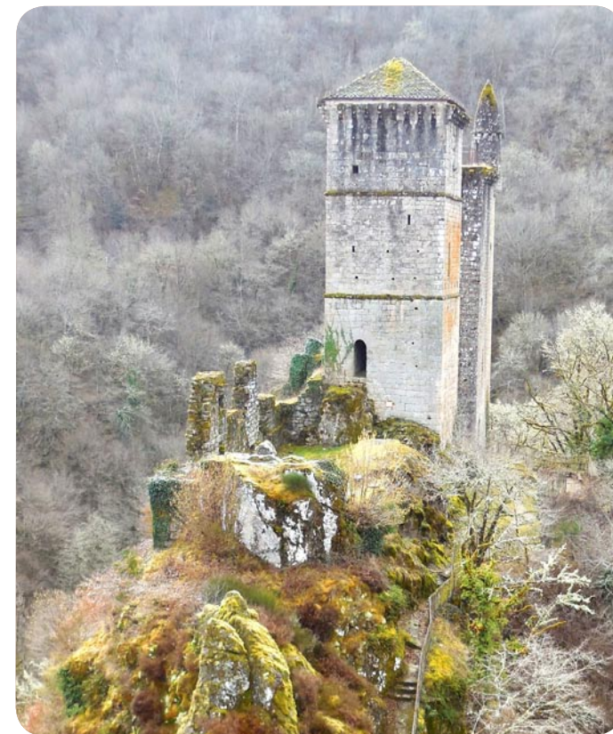
Château de Merle à Saint-Geniez-ô-Merle

UDAP | Unité départementale de l'architecture et du patrimoine CORRÈZE