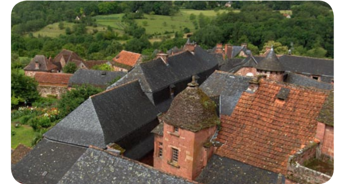
Vue aérienne du bourg de Collonges-la-Rouge

Le patrimoine religieux est riche avec les abbayes d'Aubazine, de Beaulieu, d'Uzerche ou de Meymac, du prieuré de Saint-Angel et des nombreuses églises et chapelles qui maillent le territoire. Ce sont aussi des châteaux dont les illustres noms trouvent échos dans l'Histoire : Turenne, Pompadour et Ventadour notamment.