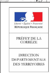
Schéma directeur d'utilisation du plan d'eau de Viam annexé au règlement particulier de police de la navigation intérieure Arrêté préfectoral du 30 janvier 2015 PNI 2014-02