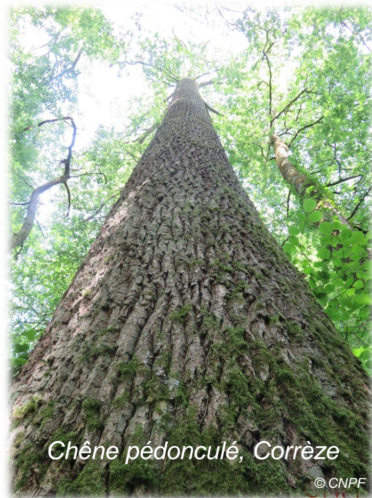
Chêne pédonculé, Corrèze