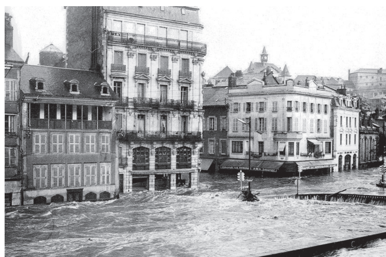
Tulle, octobre 1960