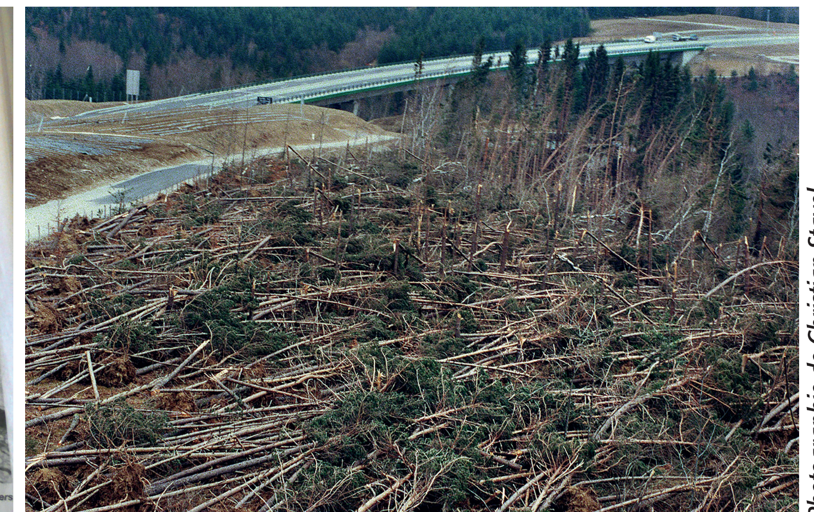
Egletons, décembre 1999