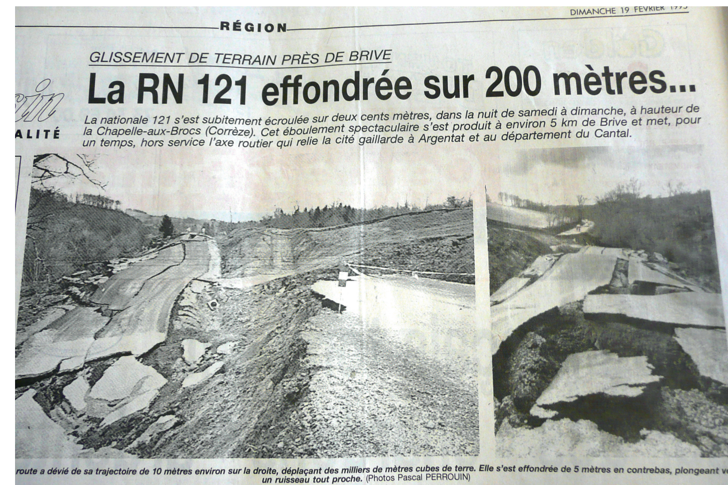
La Chapelle aux Brocs, février 1995 Journal La Montagne, 19 février 1995