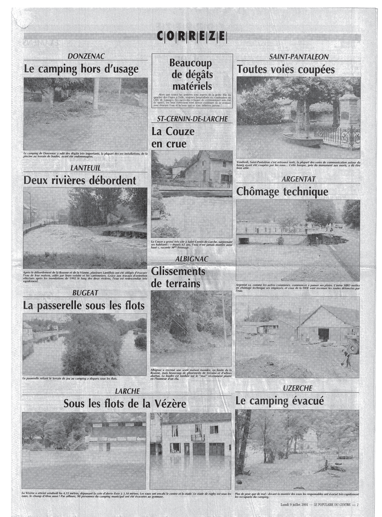
Dégâts en Corrèze des inondations et mouvements de terrains de juillet 2001. Journal Le Populaire du Centre, 9 juillet 2001