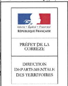
Schéma directeur d'utilisation du plan d'eau de Viam Règlement particulier de police de la navigation intérieure Arrêté préfectoral du 30 JAN. 2015