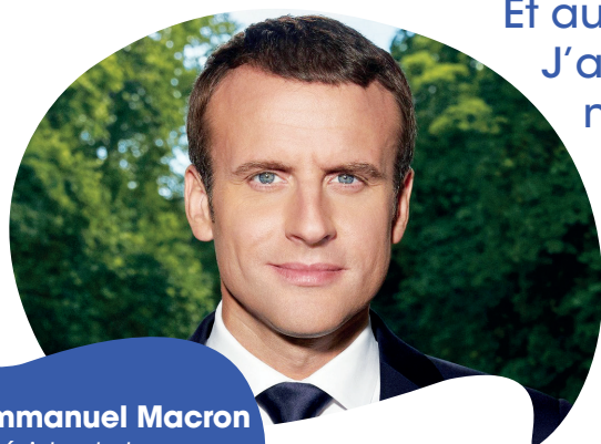
Emmanuel Macron président de la République

J'appelle à une grande mobilisation nationale pour les habitants des quartiers, une mobilisation qui concerne chacun d'entre nous. Je veux que le visage de nos quartiers ait changé d'ici la fin du quinquennat.”